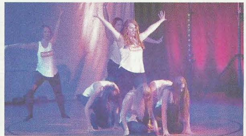
Von HipHop über Breakdance bis zu Latinosounds war am Sonnabend alles dabei.